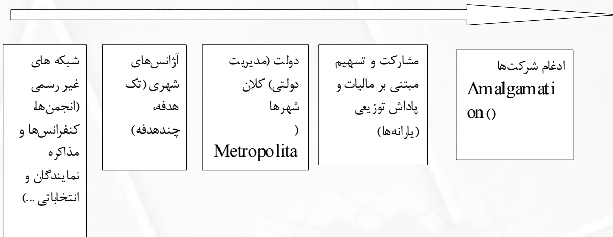
شکل ۲- نحوه اداره کلان شهرها